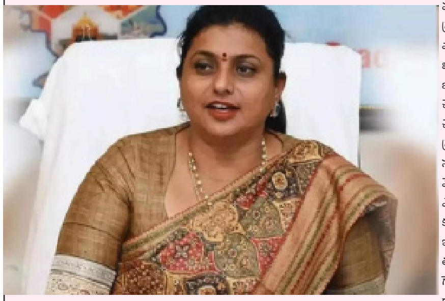
సమాజంలో మహిళల అభ్యున్నతికి కృషి చేస్తున్న స్టాలిన్ సర్కార్ ను మరోసారి ఎన్నుకోవాలని ప్రజలకు పిలుపునిచ్చారు స్టాలిన్ అందిస్తున్న సంక్షేమ పథకాలను రోజా ఆకాశానికెత్తారు. ముఖ్యంగా తమిళనాడులో మహిళల ఆర్థిక భద్రత కోసం ప్రతినెలా వారి ఖాతాల్లో నేరుగా వెయ్యి రూపాయలు జమ చేయడం వంటి పథకాలు మహిళా సాధికారతకు నిదర్శనమని ఆమె కొనియాడారు. ఇదే తరుణంలో ఆంధ్రప్రదేశ్ రాజకీయాలను ప్రస్తావించి